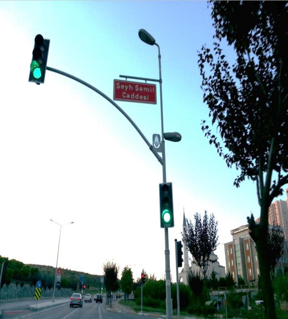
Улица имени Имама Шамиля в г. Стамбуле