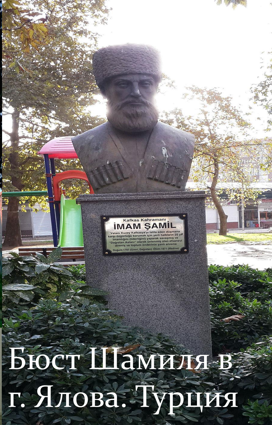
Бюст Шамиля в г. Ялова. Турция