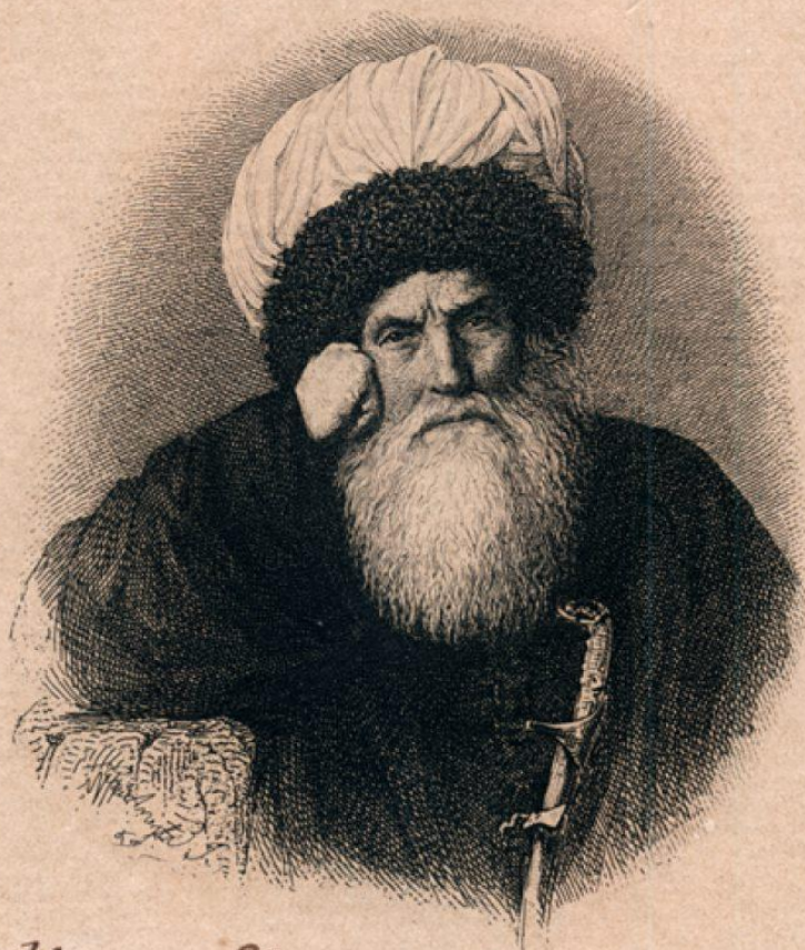
Шамилъ Чертъ и Дарестана Шамилъ, Жившій въ Ч. Кавказъ военнопленный, съ 10 Октября 1859г. по 25 Января 1868г. Гравировано съ фотографическаго снимка, изготовленнаго въ Экспедиц. Загот. Государств. Оумагъ.

ذَكَرْتُ فِي هَذِهِ الْقِصَّةِ وَأَنَا الْفَقِيرُ سَمَوِيلُ بَاوَلَاةٍ فِي ١٢٨٣